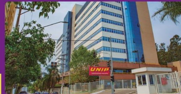
UNIP Anchieta: 2 minutos