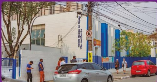
UBS Vila das Mercês: 4 minutos