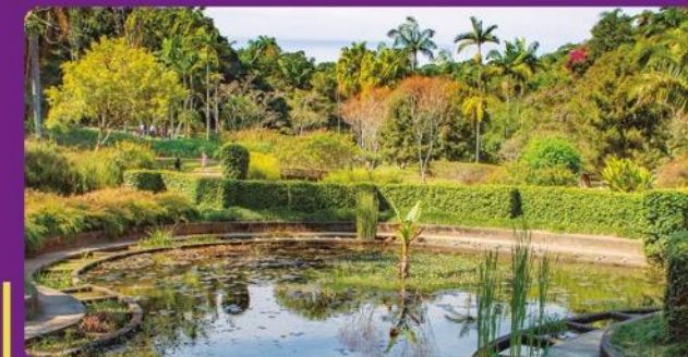
Parque do Estado/ Jardim Botânico: 10 minutos