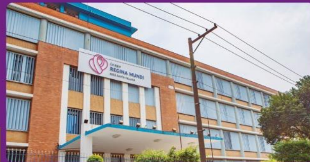
Colégio Regina Mundi: 600 metros