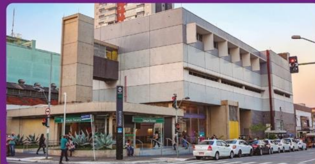
Metrô Estação Sacomã: 7 minutos