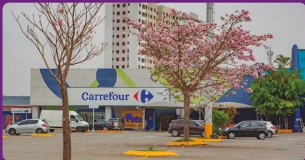
Carrefour Anchieta: em frente