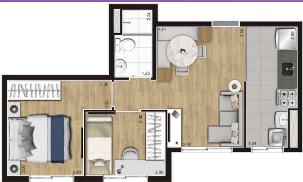
PLANTA TIPO B (Torre 01 e 02) 2 Dorms. | 38 m 2