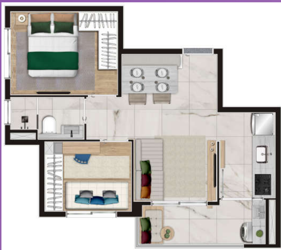
PLANTA TIPO A 2 Dorms. | 42 m 2